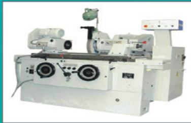
CNC Cylindrical Grinding (OMA)