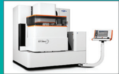
EDM Die Sinking & EDM Wire Cutting (GF)