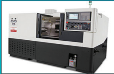
CNC Milling 3AXIS (S&T, ACE)