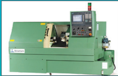
CNC Turning 3 AXIS (ACE, BFW)