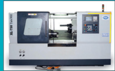
CNC Turn Mill