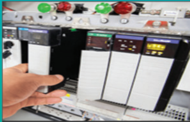
PLC & SCADA